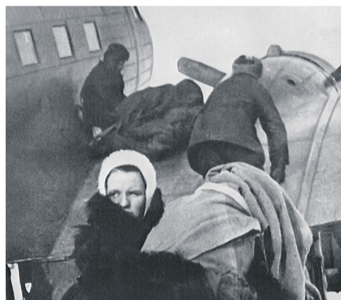
Эвакуация с Комендантского аэродрома