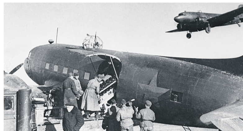
Комендантский аэродром. «Воздушный мост» с Большой землей