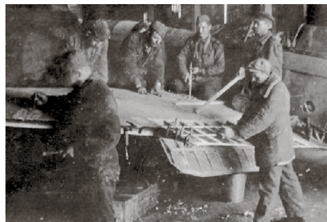
Разгрузка гражданского ПС-84, ставшего военно-транспортным самолётом Ли-2.