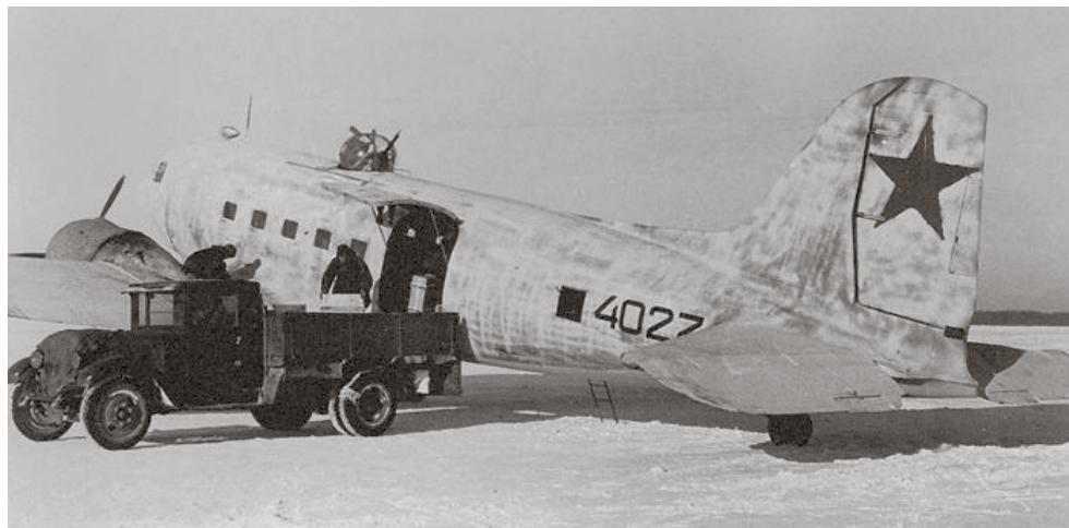
Механики Авиаремонтной базы на Комендантском аэродроме за работой.