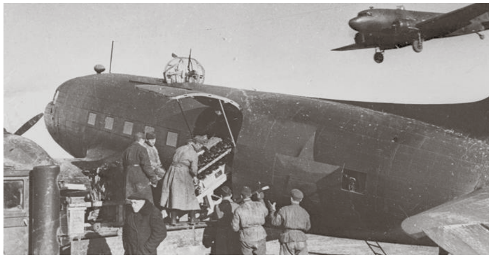
«Воздушный мост» с «Большой землей» в действии.

Около 400 инженеров и рабочих 23 завода записались добровольцами в народное ополчение. Большинство из них попали во 2-й Приморский стрелковый полк. А те, кто остался в Ленинграде, стали ведущими специалистами по ремонту авиатехники. Поэтому сюда – в Комендантский аэродром – прилетали самолеты со всей страны. Созданная объединенная ремонтная база располагалась на трех основных площадках: первая – возле устья Черной речки, а две другие – в цехах бывшего завода В.А. Лебедева, то есть около самого Комендантского аэродрома.