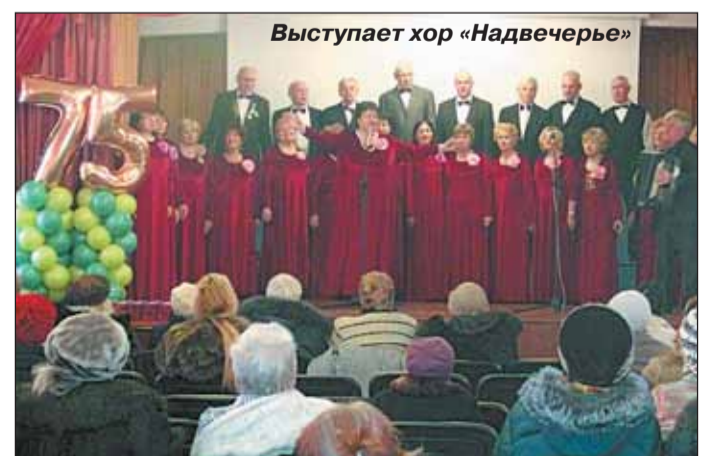
Выступает хор «Надвечерье»