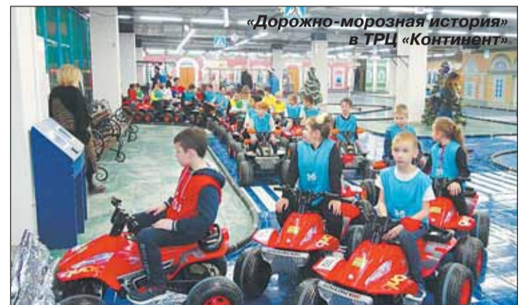
«Дорожно-морозная история» в ТРЦ «Континент»

Для ребят постарше 25 декабря в ДК «Выборгский» состоялось представление «Единорог. Легенда» – фантастическая