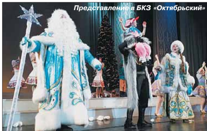
Представление в БКЗ «Октябрьский»

В рамках профилактического мероприятия «Внимание-дети!» в торгово-развлекательном центре «Континент» был проведен Марафон дорожной безопасности «Дорожно-морозная история...». Он состоялся при поддержке администрации Приморского района, Госавтоинспекции района, МО Комендантский аэродром и дворца творчества детей и молодежи «Молодежный творческий Форум Китеж плюс». В мероприятии приняли участие около 500 человек – не только учащиеся образовательных учреждений, но и их родители. На цокольном этаже торгового комплекса «Континент» на базе умного горо-