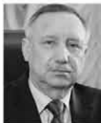
Александр БЕГЛОВ, губернатор Санкт-Петербурга